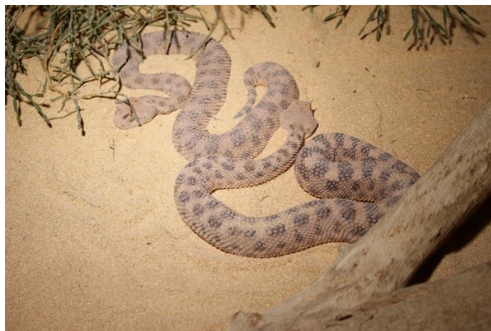
Her ser du en hoggorm . Hoggormen er giftig.

vrikk (m): når man får en vrikk i foten, skader man et ledd (fordi man vrir foten for mye)