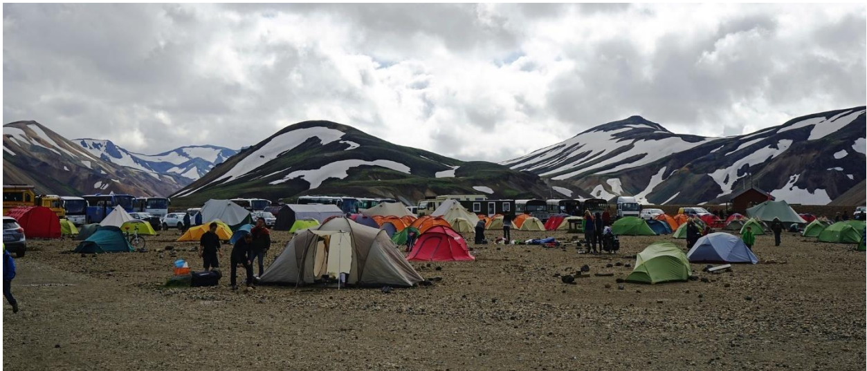
Her ser du en leirplass midt på fjellet.