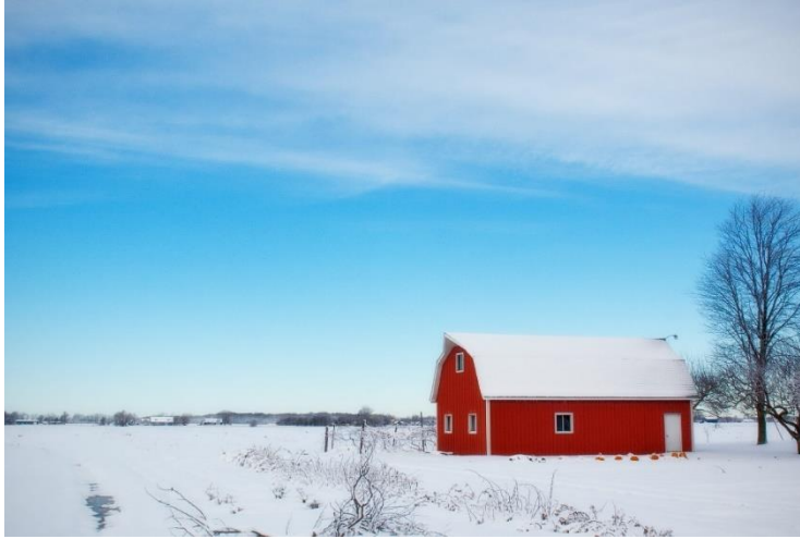
Her ser du en typisk norsk låve.